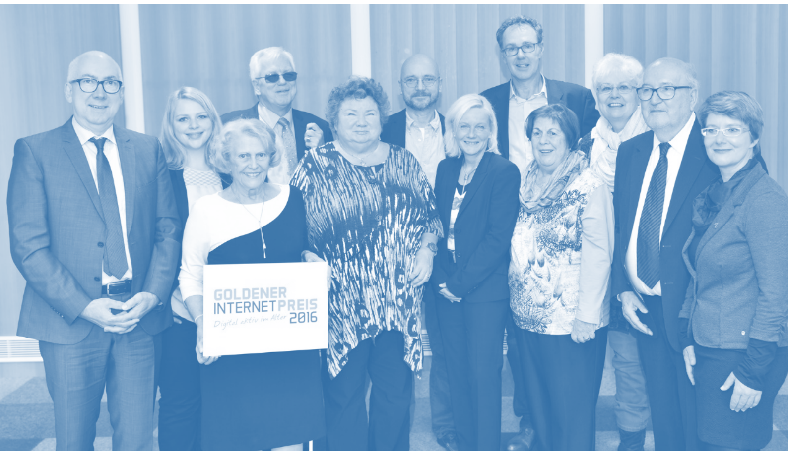
Fünf Senioren-Initiativen und drei Privatpersonen erhielten den Goldenen Internetpreis 2016.

Die Preisträger des Goldenen Internetpreises 2016 stehen fest. Alle ausgezeichneten Senioren-Initiativen und Privatpersonen setzen neue Medien wegweisend ein – zum Teil bis ins hohe Alter. Sie nutzen versiert die gesamte Bandbreite der digitalen Welt: für mehr Selbstständigkeit, zur Information, für erfolgreiche Öffentlichkeitsarbeit, zum Austausch bei großen Herausforderungen und zur Kommunikation. Die prämierten Projekte zeichnen sich durch Kreativität, Nutzen und Übertragbarkeit aus. Sie zeigen, wie der Umgang mit neuen Medien zur gesellschaftlichen Teilhabe älterer Menschen beiträgt. Die Preisträger zwischen 20 und 85 Jahren kommen aus Berlin, Bayern, Niedersachsen und Nordrhein-Westfalen. In drei Kategorien würdigen die Veranstalter die alltägliche Nutzung digitaler Medien im Alter, das soziale Engagement mit Hilfe von Online-Anwendungen sowie die Weiterbildung von Seniorinnen und Senioren im IT-Bereich.