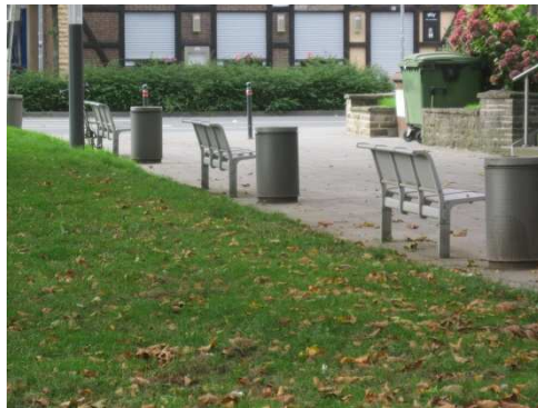
( Stand der Sitzbänke )