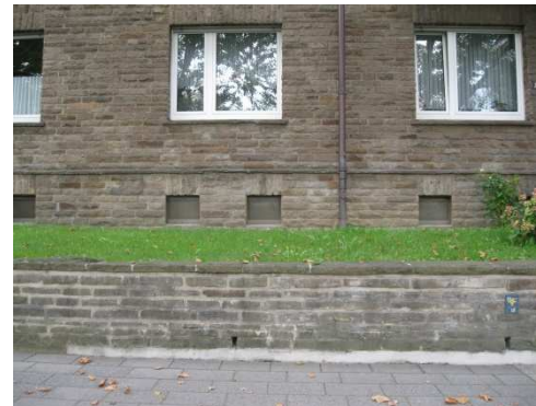
( Blick von den Sitzbänken )

Die Bänke sollten Richtung Bahnhof ausgerichtet werden.