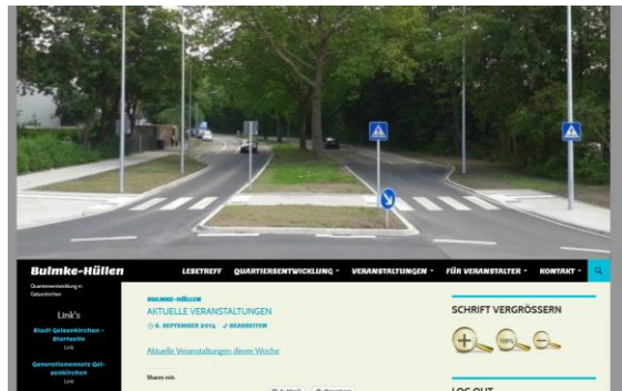
Screenshot Website Bulmke-Hüllen

Eine Webseite, die nicht uns gehört sondern uns allen zur Verfügung steht, die bei der Entwicklung ihrer Quartiere mitwirken möchten.